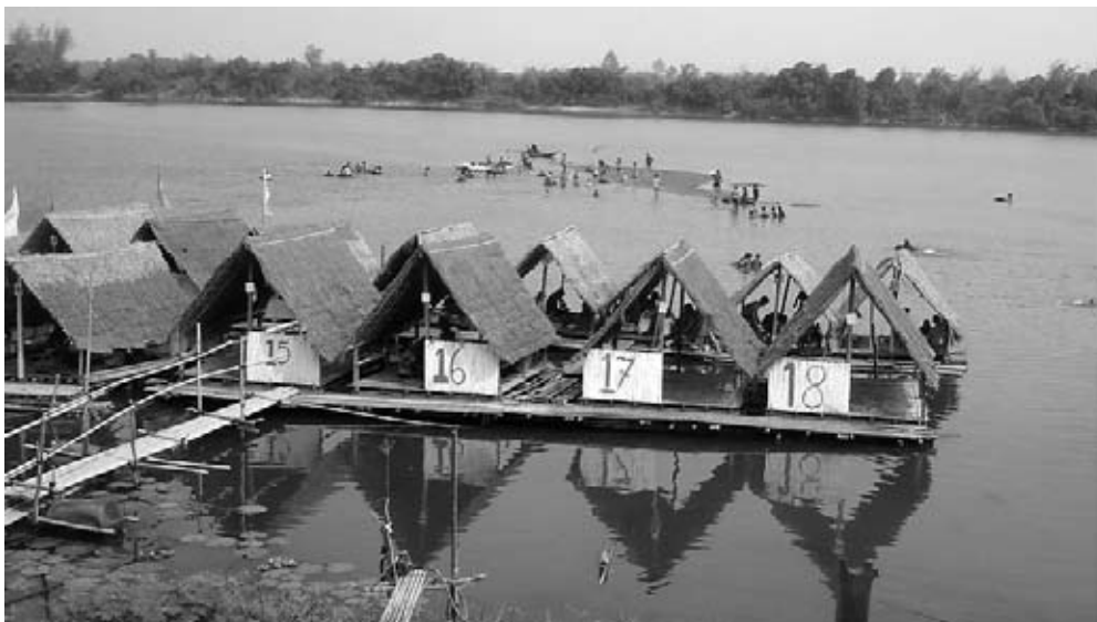
ภาพที่ 2 ร้านอาหารริมแม่น้ำในชุมชนปรารธนา

ในช่วงที่กิจการร้านขายอาหารเริ่มจะเป็นที่สนใจ โดยเฉพาะจากลูกค้าที่ขับรถมาจากตัวเมืองนั้น ส.ส. เขตในสมัยนั้นได้จัดสรรงบประมาณมาทำถนนลาดยางจากเส้นทางหลวงชนบทเข้าสู่บริเวณหาดริมแม่น้ำใกล้ๆ กับที่ตั้งของร้านขายอาหาร ในปี พ.ศ. 2549 ผู้สมัครรับเลือกตั้งสมาชิกองค์การบริหารส่วนจังหวัด (อบจ.) เข้ามาหาเสียงกับชาวบ้านใน “ชุมชนปรารธนา” รวมทั้งเข้ามาพูดคุยกับชาวบ้านที่ประกอบกิจการร้านอาหารริมแม่น้ำ ในครั้งนั้นเอง ยายอิมและพวกเสน่อว่าอยากให้ทาง อบจ. เข้ามาพัฒนาถนนคอนกรีตบริเวณหน้าร้านค้า เพื่อเป็นส่วนต่อขยายจากถนนลาดยางที่ทาง ส.ส. ได้สนับสนุนมาก่อนหน้านี้ การขอการสนับสนุนในช่วงหาเสียงครั้งนั้นยังผลให้พื้นที่บริเวณหาดได้รับการพัฒนาเพื่อการท่องเที่ยวมากขึ้น การขยายตัวของจำนวนผู้ประกอบการที่ตามมาและปริมาณนักท่องเที่ยวจากนอกชุมชนนำมาซึ่งความร่วมมือระหว่างชาวบ้านผู้ประกอบการร้านค้าด้วยกันเอง เพื่อจัดสรรพื้นที่และการดูแลความเรียบร้อยอย่างเป็นระบบ (ดูภาพที่ 2) ทั้งยังมีการคัดเลือก “ประธานหาด” เพื่อทำหน้าที่ในการดูแลประสานงานการจัดการพื้นที่หาดริมแม่น้ำร่วมกับคณะกรรมการหมู่บ้านอีกด้วย นอกจากนี้ เมื่อรายได้จากกิจการร้านค้าริมแม่น้ำมีมากขึ้น ชาวบ้านที่ประกอบการร้านค้าริมแม่น้ำยังจัดให้มีพิธีไหว้ผีปู่ตาประจำหมู่บ้านเพิ่มขึ้นเป็นพิเศษ จากที่แต่เดิมชาวบ้านทั้งหมดร่วมกันจัดเพียงปีละหนึ่งครั้ง นอกจากนี้ ชาวบ้านที่ประกอบกิจการร้านอาหารยังจัดให้มีการทำบุญไหว้ผีปากบ่ungsปีละสองถึงสามครั้ง เพื่อเป็นการตอบแทนสิ่งศักดิ์สิทธิ์ในพื้นที่ที่ช่วยคุ้มครองดูแลผู้ประกอบการและลูกค้าที่มารับประทานอาหารและลงเล่นน้ำในแม่น้ำ