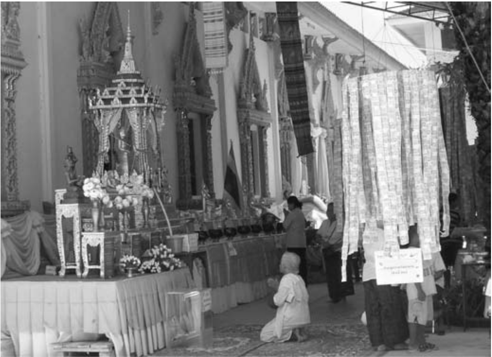
ภาพที่ 1 มหกรรมงานบุญในวัดประจำชุมชนปรารธนา ที่มาพร้อมกับการหลังไหลของเงินตรา จากนักท่องเที่ยวยุคศรัทธา

(ดูภาพที่ 1) ในทุกๆ วันสำคัญทางศาสนา ชาวบ้านจะจัดอาหารมาทำบุญเลี้ยงพระมากกว่าวันปกติ และวัดเองก็มักจะมีการจัดให้มีการระดมทุนผ่านการรับบริจาคทำบุญเพื่อการส่งเสริมกิจการของวัด และบ่อยครั้งวัดก็นำเงินบางส่วนไปใช้ในกิจกรรมพัฒนาชุมชนด้วย ในการจัดภัตตาหารเลี้ยงพระและในกิจกรรมงานบุญแต่ละครั้ง เรามักจะเห็นชาวบ้านจำนวนมากผลัดเปลี่ยนกันเข้ามามีส่วนร่วมในการเป็นเจ้าภาพในการดูแลรับผิดชอบเรื่องสำหรับอาหารสำหรับถวายพระ หรือมีส่วนในการอุทิศแรงกายในการบริหารจัดการติดต่อเตรียมการ แทบจะทุกครั้งที่มีงานสำคัญๆ ยายอ้อมจะเป็นหนึ่งในชาวบ้านประจำที่ไม่เพียงแต่ร่วมในการบริจาคตर्फอย่างเดียวส่งเสริมกิจการของวัดและชุมชน หากแต่อาสาในการเป็นเจ้าภาพดูแลช่วยงานของวัดอยู่อย่างสม่ำเสมอ