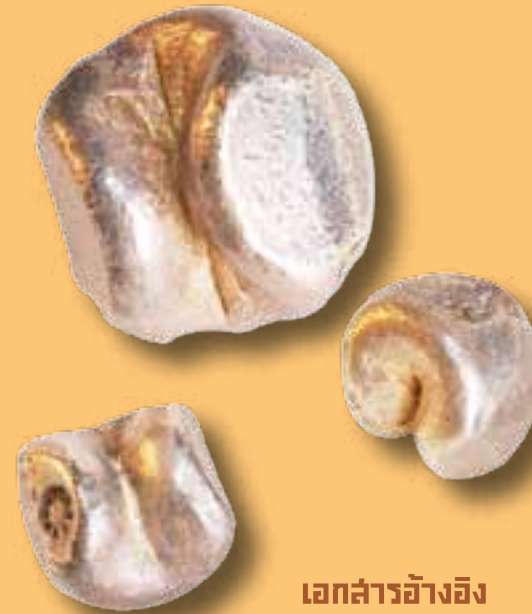
เอกสารอ้างอิง

คำว่า “เงิน” ที่ใครหลายๆ คนคุ้นชิน กว่าจะมาเป็นเงินที่เราใช้ในปัจจุบันนั้นมีความเป็นมาและการเปลี่ยนแปลงไปตามแต่ความเหมาะสมในแต่ละช่วงเวลาและสังคมที่เปลี่ยนแปลงไป ทั้งนี้อาจรวมถึงการเปลี่ยนแปลงความคิดของผู้ใช้ “เงิน” ที่อาจมอง “เงิน” แตกต่างจาก “เงิน” ในอดีต