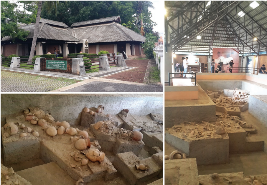
ภาพที่ 3 พิพิธภัณฑ์ประจำแหล่งโบราณคดีบ้านเชียง จัดแสดงหลุมขุดค้นจำลอง