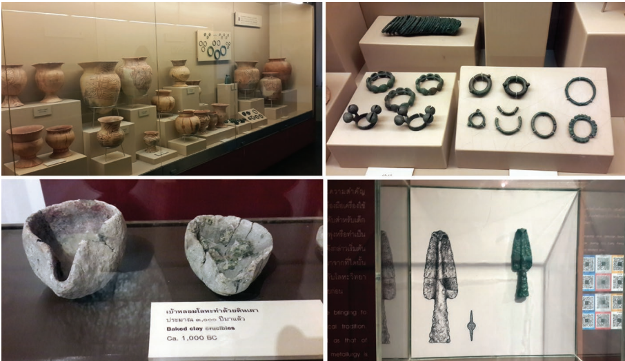
ภาพที่ 4 โบราณวัตถุจัดแสดงในนิทรรศการ พิพิธภัณฑ์สถานแห่งชาติ บ้านเชียง