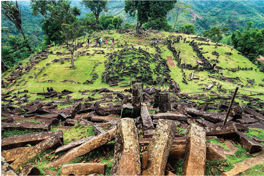
ภาพที่ 2 แหล่งโบราณคดี กุญงปาดัง ประเทศอินโดนีเซีย

ของสิ่งก่อสร้างหรืออาจจะเป็นห้องที่อยู่ภายใต้พีระมิด แล้วเรียกสิ่งที่ค้นพบนี้ว่าเป็นสิ่งมหัศจรรย์ของโลก ที่เก่าแก่กว่าสโตนเฮนจ์ของอังกฤษและพีระมิดของอียิปต์ แต่ความตื่นเต็นยินดีที่ภูมิภาคอาเซียนจะมีสิ่งมหัศจรรย์ของโลกก็ถูกดับฝันลงภายในเวลาอันรวดเร็ว